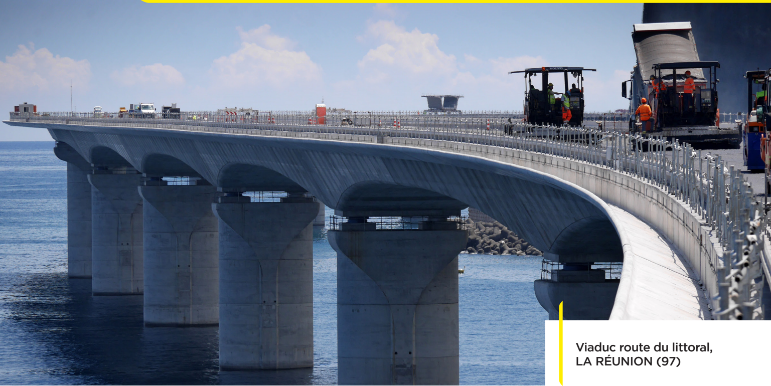
Viaduc route du littoral, LA RÉUNION (97)