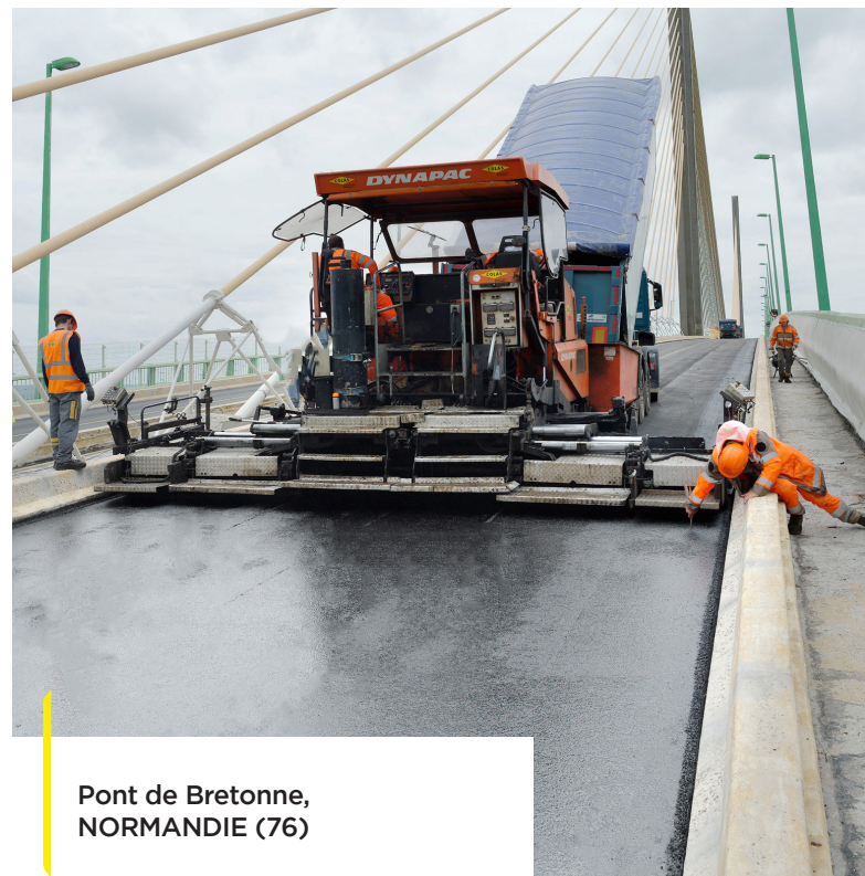
Pont de Bretagne, NORMANDIE (76)