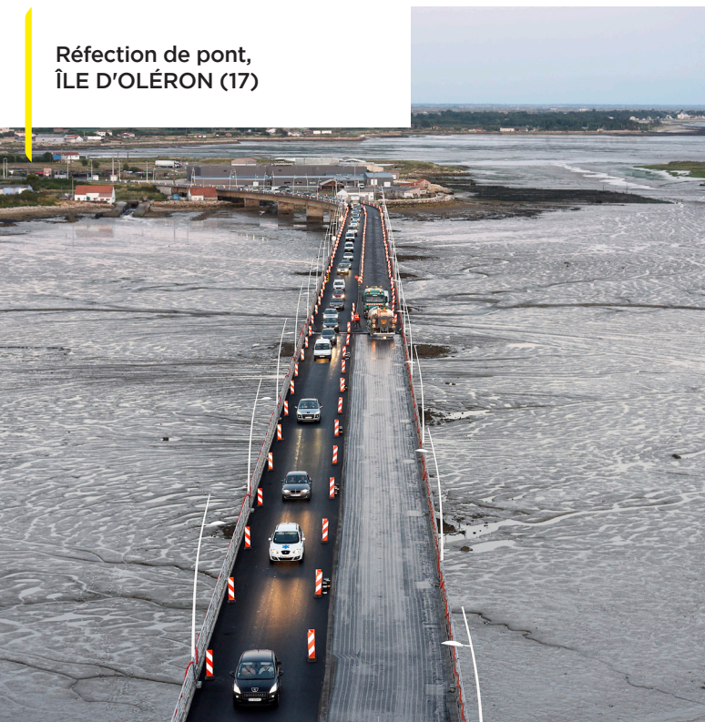
Réfection de pont, ÎLE D'OLÉRON (17)